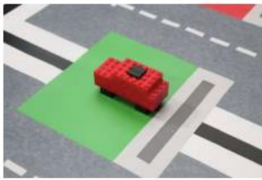
停車格內的車的擺放方式