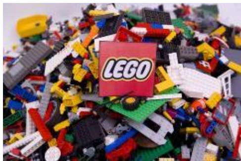
LEGO 底板及所有LEGO 積木