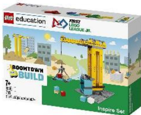
Inspire Model (靈感啟發套組) NO. 45810