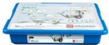
WeDo 2.0 NO. 45300