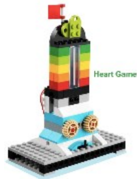
Heart Game (心率機)