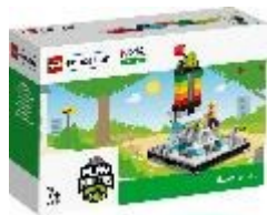
Explore Set (探索套組) NO. 45814