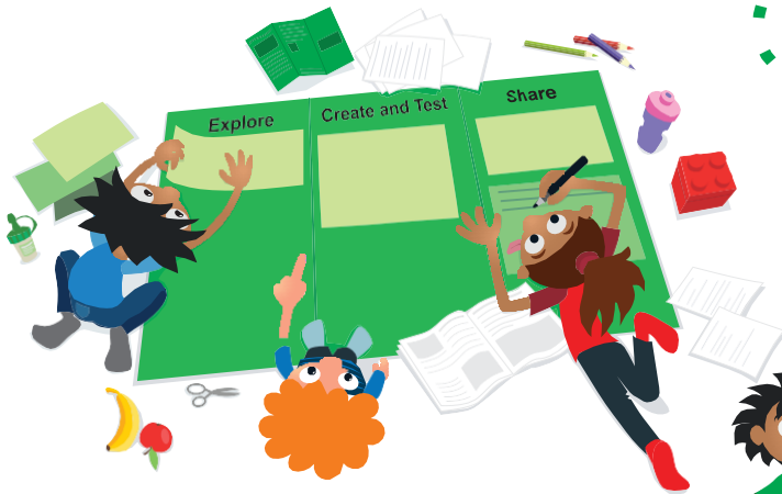
參與活動歡樂慶祝